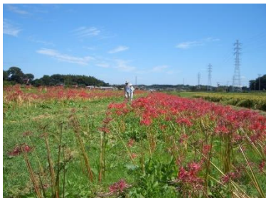
小出川 彼岸花 9月下旬に見頃を迎える。藤沢、茅ヶ崎、寒川と約3km続く。