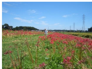
小出川 彼岸花 9月下旬に見頃を迎える。藤沢、茅ヶ崎、寒川と約3km続く。