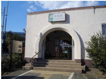
倉見駅 1926年(大正15年) 4月1日開業。