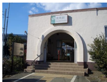
倉見駅 1926年(大正15年) 4月1日開業。